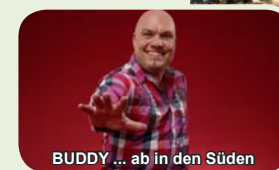
BUDDY ... ab in den Süden

... die maritime Veranstaltung mit Tradition!