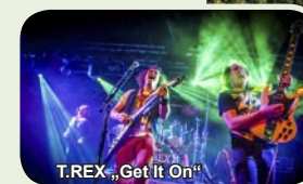
T.REX „Get It On“