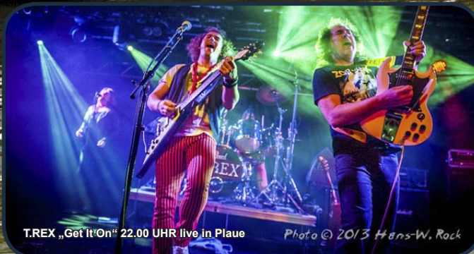
T.REX „Get It On“ 22.00 UHR live in Plaue

22.00 Uhr T.REX live in Plaue mit all den großen Hits